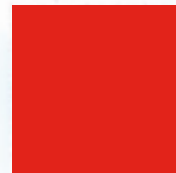
Pantone 485 C